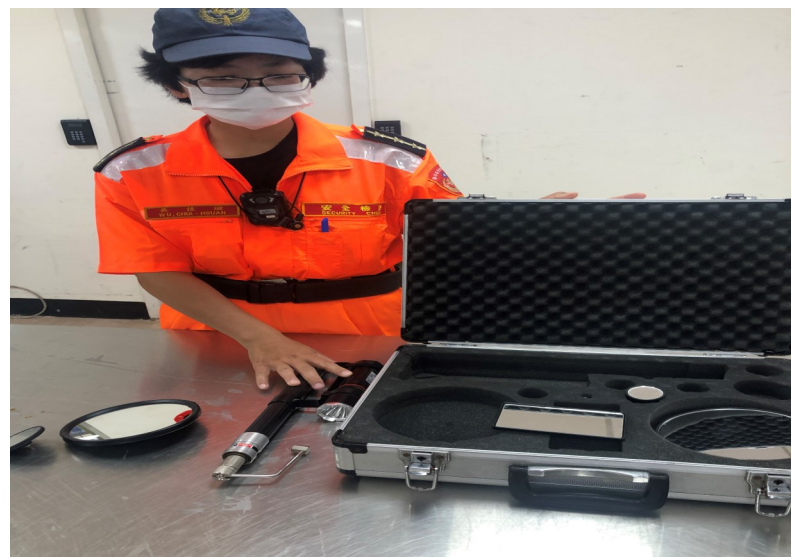
圖為安檢人員針對國內客輪往返台澎金馬地區時，旅客運返汽機車時，針對車下隱密處使用搜索檢查器加強檢查是否有藏匿違禁物品。

此外商港安檢所人員針對手提行李、隨身行李安全檢查部分，於發現行李有異狀時，因為 x 光機有角度問題，行李需再重新放回 x 光機二次檢查，並從另一個角度掃描，如確有問題，會請旅客至旁邊，並由幹部及安檢人員請旅客實施人工安全檢查。