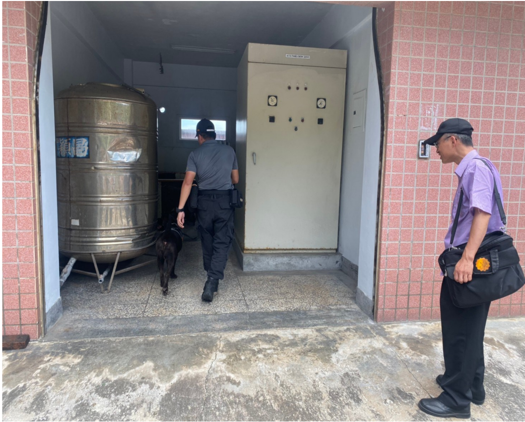
圖為偵搜犬在基地內運用地形上之障礙，訓練偵搜犬如何找到違禁物以並進行各項偵搜犬與領犬員培養默契，以利增加台灣海巡邊境防疫、防衛力。

而在偵搜犬區隊部分，其目前為海巡署 2019 年 9 月 16 日新成立之單位，訓練基地為桃園，並在北部分署、南部分署以及金馬澎分署都設置偵搜犬區隊，而目前在北部分署之偵搜犬區隊總共有五隻偵搜犬，兩隻負責毒品偵測，兩隻負責肉品檢疫工作，一隻負責偵爆炸彈，其偵搜犬早上實施基地內訓練，下午則會實際到達商港內進行訓練，並配