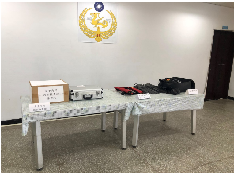
為八斗子漁港安檢所人員值勤時所需使用之裝備器材。

最後於現場與海巡盟軍一起探討漁港安檢執法上之困境，其強調目前缺乏強而有力之法律支撐，再加上犯罪日新月異，而制度及裝備不及等執法困境，而這些執法上之困境是否與警察機關執行安全檢查時亦同樣面臨呢？值得我們更進一步研究。