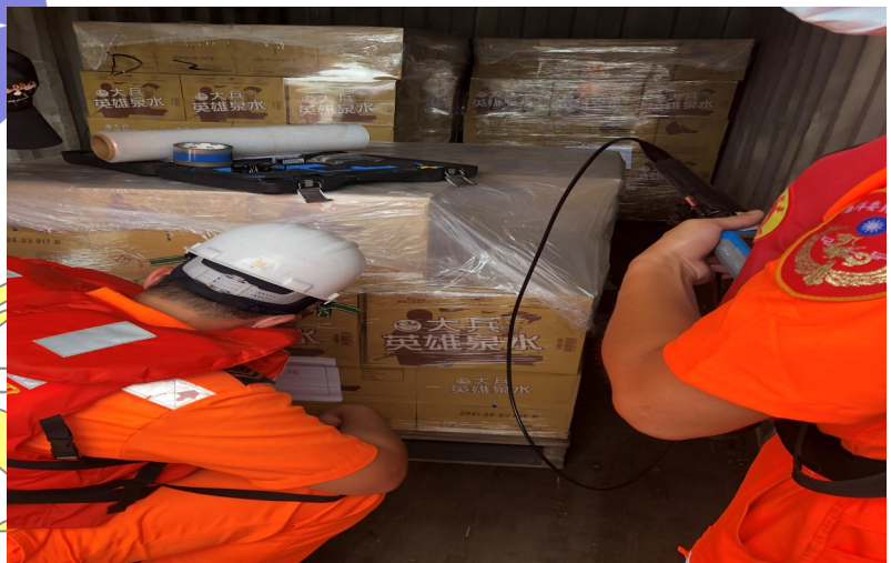
基隆商港安檢人員，正在實施貨物安全檢查工作，其利用電子內視搜索鏡實施貨物檢查，檢查是否有夾藏槍枝、毒品等違禁物。