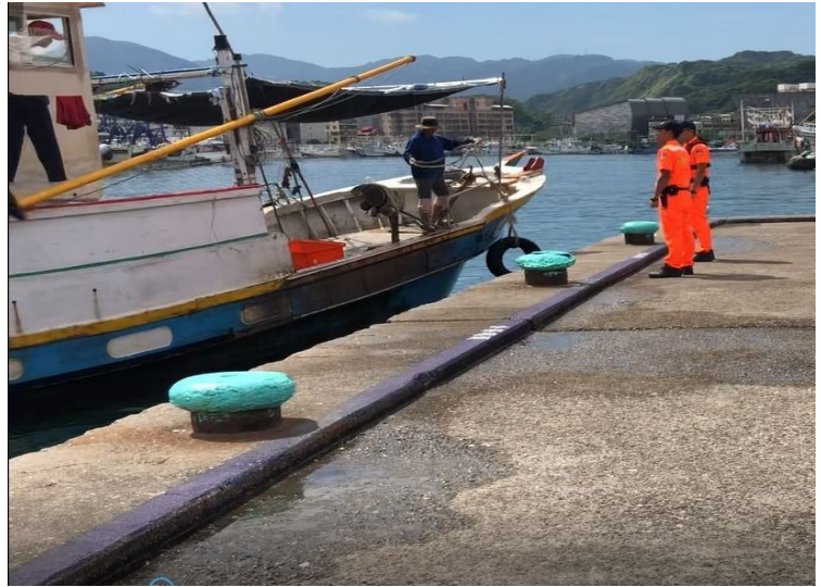
圖為八斗子漁港之岸巡人員實際實施登船安全檢查之情形，以有效杜絕不法情事，維護國境安

此外八斗子安檢所人員並詳細介紹與其他友軍合作之情形，如與移民署、漁業署、地方縣市政府、地方區漁會、警察機關、消防機關、交通部風管處、漁業電台等友軍機關一起合作，達到阻絕危害於國境線上，並發揮行政一體之作用。