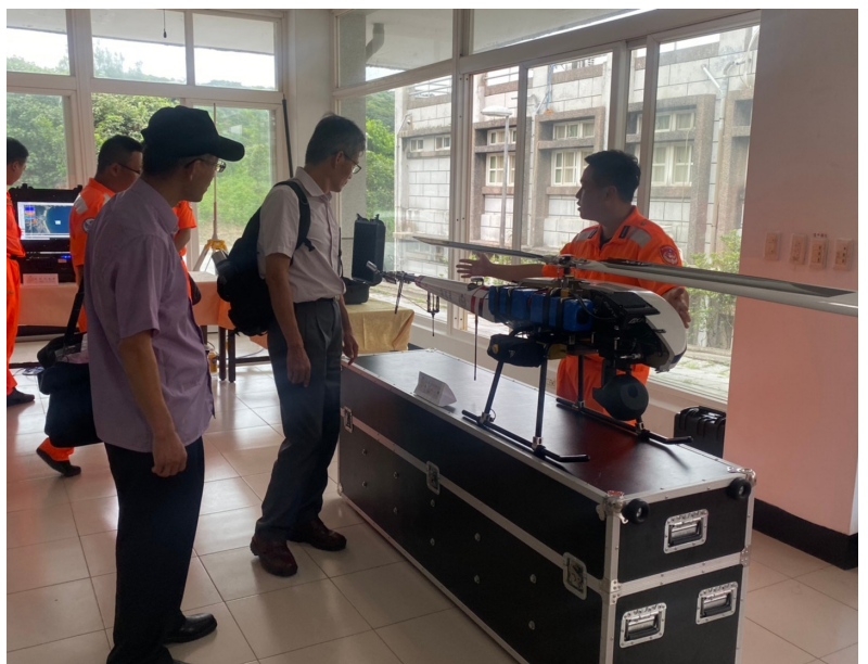
二一中隊下之無人機區隊，平常利用無人機進行偵查、救生救難以及協助搜救，其平常利用模擬系統進行訓練。

UAV 無人機區隊其主要協助偵查、救生就難、協助搜救以及協助環保局空拍海洋垃圾汙染等作為，當天播放其無人機演練畫面，無人機在空中拍攝時並能即時在其電腦螢幕顯示，解析度極高，空投救生衣部分也準確落在目標處，此外並有可見光模式及熱顯像模式，可見光模式變焦可達 30 倍，白天時在高空還能拍到路面上車牌號碼，隊員還能進行導航規劃，設定自動導航之功能，以利海巡署完成之任務，其無人機之科技儀器為海巡署執法之利器。